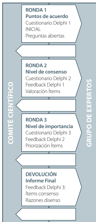
Figura 2. Esquema Rondas de la Fase 3. Adaptación de Pozo et al., 2007

del estudio, el consenso. La Figura 2 muestra el recorrido por etapas y la ronda de consultas que corresponde a cada una.