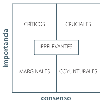
Figura 3. Distribución de resultados Adaptado de Ruiz Olabuénaga (2003)

Para tener una idea detallada del consenso se va a realizar un análisis de los 145 ítems siguiendo el siguiente esquema: 1) nivel de consenso y homogeneidad general; 2) nivel de consenso y diseño por grupos de expertos; y 3) clasificación de los ítems en las cinco categorías. Durante el análisis se completa la información con algunos comentarios sobre el contenido, el diseño de algún experto y la génesis de algunos de los ítems.